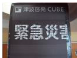
B 正方形の電光掲示板(新案)