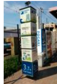
D 武庫川団地前駅 駅前の歩道から見る