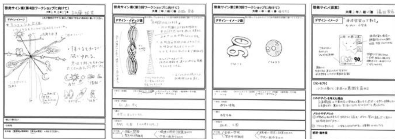
A ゆれるモニュメント