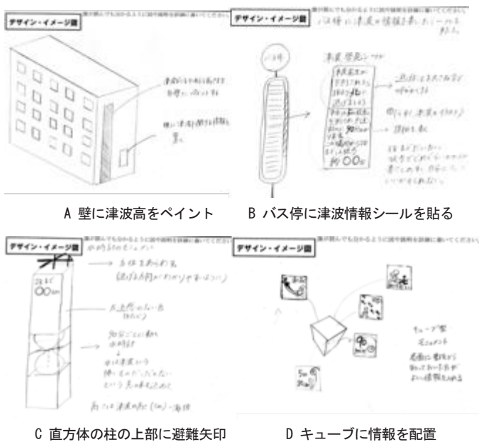
図3 ワークシートの事例2

(5) 津波の到達時間・高さ・避難方向を分かりやすく表現 提供すべき基本情報として、災害対策課から強く要望されていた。視認性、可読性について工夫と配慮が必要であった。災害対策課からは、特に、避難方向について、北側、山側、JR 以北の 3 種類が提示された。この 3 つは、実際には、設置場所によって方向が必ずしも一致しない場合があり、表示には注意が必要であると考えられた。