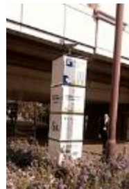
C 香櫨園駅 駅前の歩道から見る