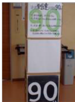
B 近距離からの見え方