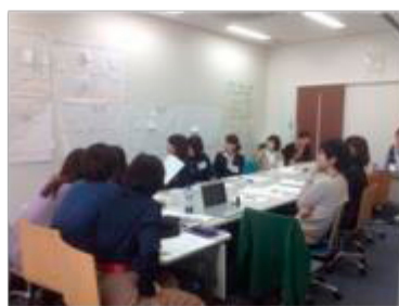
B 軸によるワークシートの整理