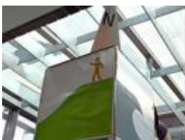
A 避難方向と矢印の矛盾(旧案)