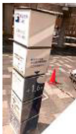
B 今津駅 階段から見る