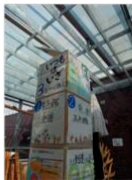
C 縦・横の面のつながり