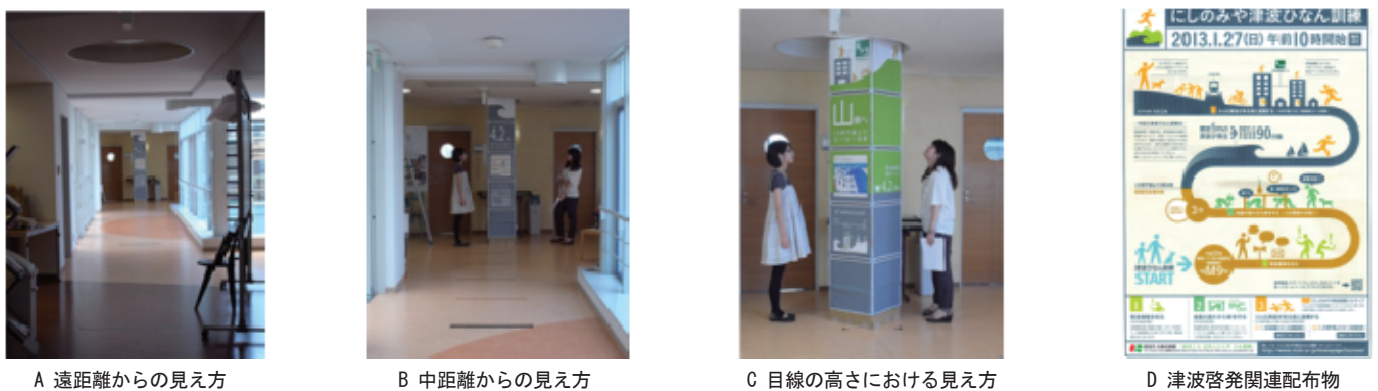
図6 西宮市旧案原寸模型による視覚的効果の検討