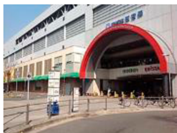
A 西宮駅 駅前ロータリーから見る