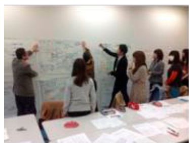
A 各アイデアの発表