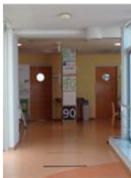
A 中距離からの見え方