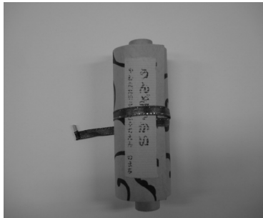
写真1 巻物のプログラムの例