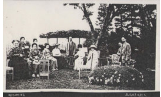
付図1 赤坂邸にて明治44(1911)年