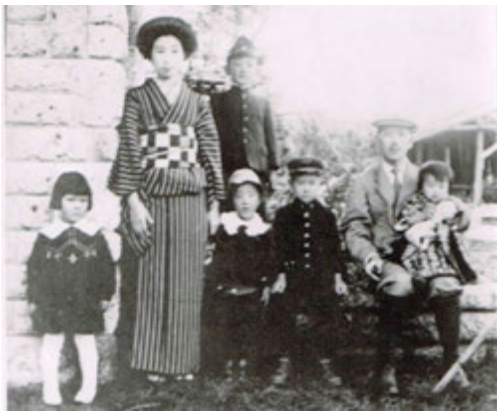
図3 駒沢の家 家族と共に