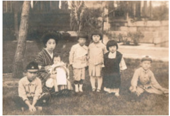
図2 母タカに抱かれて 大正8(1919)年