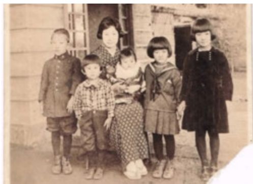
図5 駒沢の家でタカ兄姉と