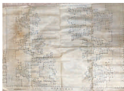
図8 アイロン転写図(C)

シンガークラフトは、土台布に縫い付ける糸の色を部分的に変えることで、絵画の様な表現も可能である。予め、土台布に図案を描いておく必要があり、図案の描画を簡単にするためにシンガークラフト用のアイロン転写図が発明された。アイロン転写図のインキ面を下側にして布にあて、上からアイロンをかけると図案が布に転写される。図8はアイロン転写図の実物である。薄葉紙のような材質で、横84cm縦60cmの図案が2枚あった。『シンガークラフト使用全書』に記載のあった図案(A)~(C) 25) のうち、(B)、(C)の図案の転写図で、図8は図案(C)に相当する。転写紙には、約1cmの大きさの方眼に合わせるように図案が描かれており、図9のように、色の凡例によって各部の配色が決められている。図案(C)は、濃緑色、赤、薄緑、薄茶の4色が指定されていた。シンガークラフトでは、色の指定幅に合わせて定規に糸を巻き、一段ずつ縫い付けることで図案と同じものが完成する。筆者は、コンピュータ上で転写図の配色通りに着色をおこない、図案(B)と図案(C)の着色完成イメージ図を作成した(図10, 11)。