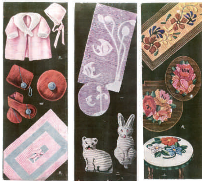
図1 シンガークラフトの作例 20)

シンガークラフトに関する記事は、昭和8(1933)年10月17日号の『時事新報』、昭和9(1934)年2月号の『婦人倶楽部』、同年9月の『婦人画報』にも掲載されていたことから、シンガークラフトは少なくとも昭和8(1933)年には登場していたといえる。