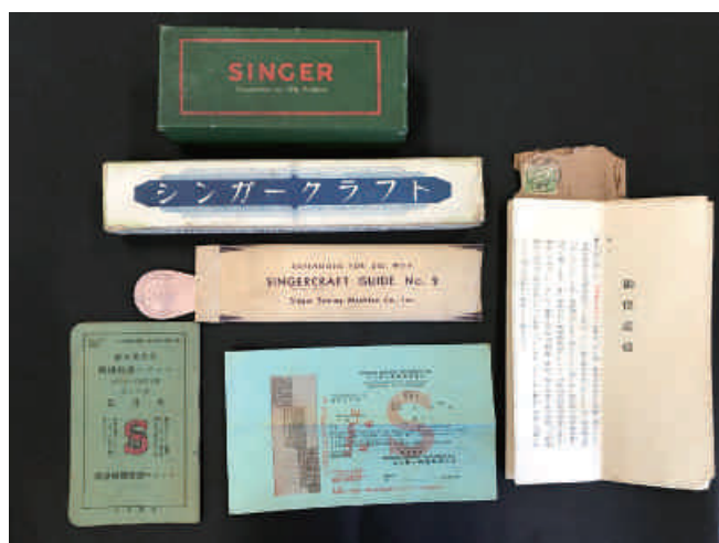
図2 入手した資料

シンガークラフトでは、クラフト定規を基本用具として主に使用する。実物資料には含まれていなかったが、広幅定規と呼ばれる拡張具もあり、広幅定規をクラフト定規に継ぎ足して用いれば、房飾りを作ったり、特別な縫い方をしたりすることが可能である。クラフト定規には毛糸を巻きつけ、土台布と押え金の間に置き、クラフト定規のスリット部分をミシンで縫う(図5)。クラフト定規の上端には小型のナイフがついており、ナイフで毛糸の輪を切りながら手前に引き抜く。輪を残す場合は予めナイフを外した状態で引き抜く。引き抜いた後に再度押さえ縫いをする(図6)。これを繰り返して列を増やし、土台布全体に毛糸を縫い付けていくのである。