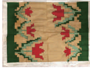
図11 転写図(C) 着色イメージ (筆者作成)