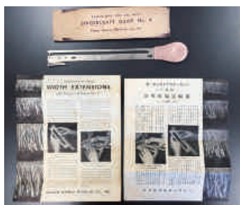
図4 シンガークラフトガイド(クラフト定規)と説明書