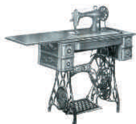
図3 シンガーミシン第十五種K八十三型 21)