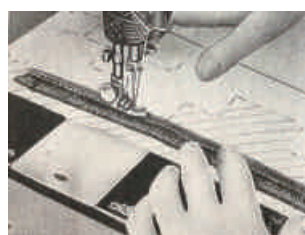
図6 定規を抜き押さえ縫い 23)

輪の部分の処理の方法によって、土台布の表面に様々な装飾を施すことが可能である。図7の上段2段は輪を切らずに縫い付けている状態である。次の4段は輪を切った状態である。その下部は、更に糸を刈り込み、短くすることで糸の列の境界を目立たないようにした状態である。糸の縫い付ける際の密度によっても表面の表情は異なる。また、図7の様に濃淡2色の毛糸を同時に巻き付けることにより、独自の配色を楽しむことも可能である。