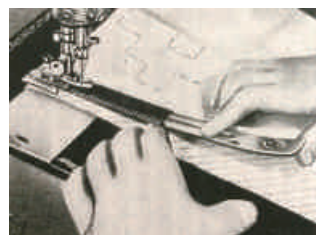
図5 一列目の縫い始め 22)