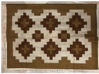
図10 転写図(B) 着色イメージ (筆者作成)