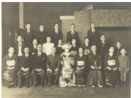
图 6 N 家 (昭和 18 年)