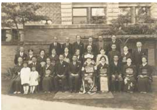
图 4 A 家 (昭和 7 年)