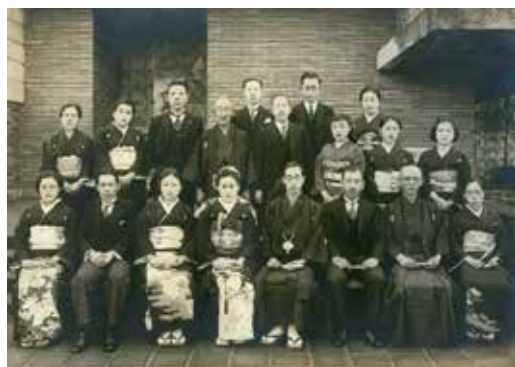
图 5 L 家 (昭和 15 年)