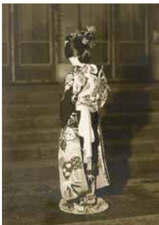
图 1 E 家 (昭和 10 年)