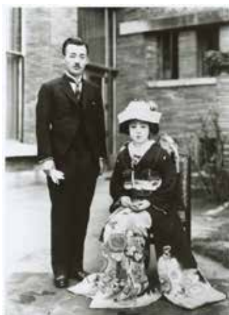
图 2 F 家 (昭和 10 年)