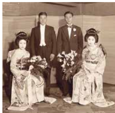
图 3 H 家 (昭和 11 年)