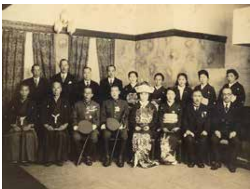
图 7 O 家 (昭和 18 年)